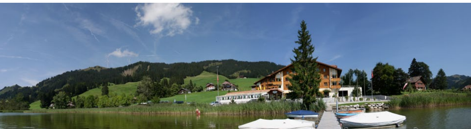
Une large majorité appuie le projet du Schwyberg