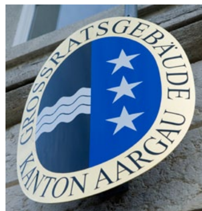
Le Grand Conseil donne son feu vert