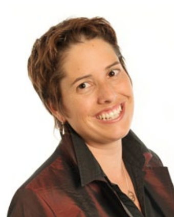
Isabelle Chevalley, nouvelle élue vaudoise