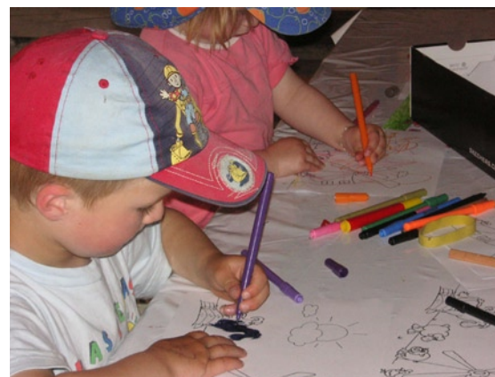
Lokal Handeln für die nächste Generation: Heitersberg engagiert am Global Windday