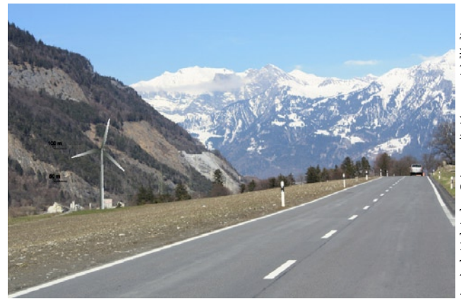
Après le Valais, les Grisons s'intéressent à l'éolien