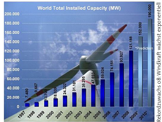
Rekordzuwachs 08: Windkraft wächst exponentiell