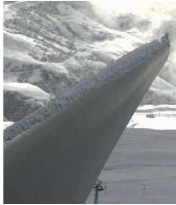
Vereisungsworkshop: erstmals in der Schweiz