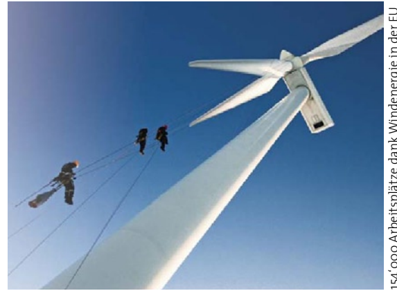
154'000 Arbeitsplätze dank Windenergie in der EU