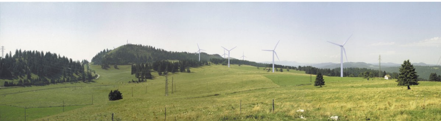
Windgesetz NE: Neue Hürde für Crêt-Meuron?