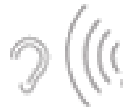
Les nuisances sonores