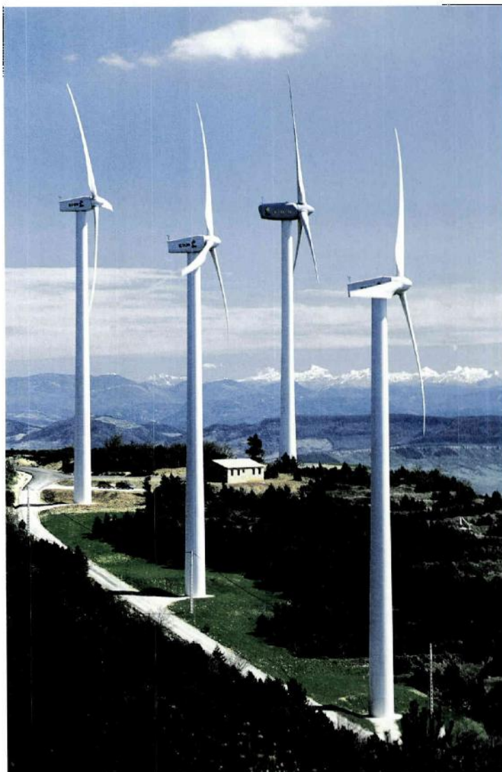
Windpark Aizkibel (Spanien).