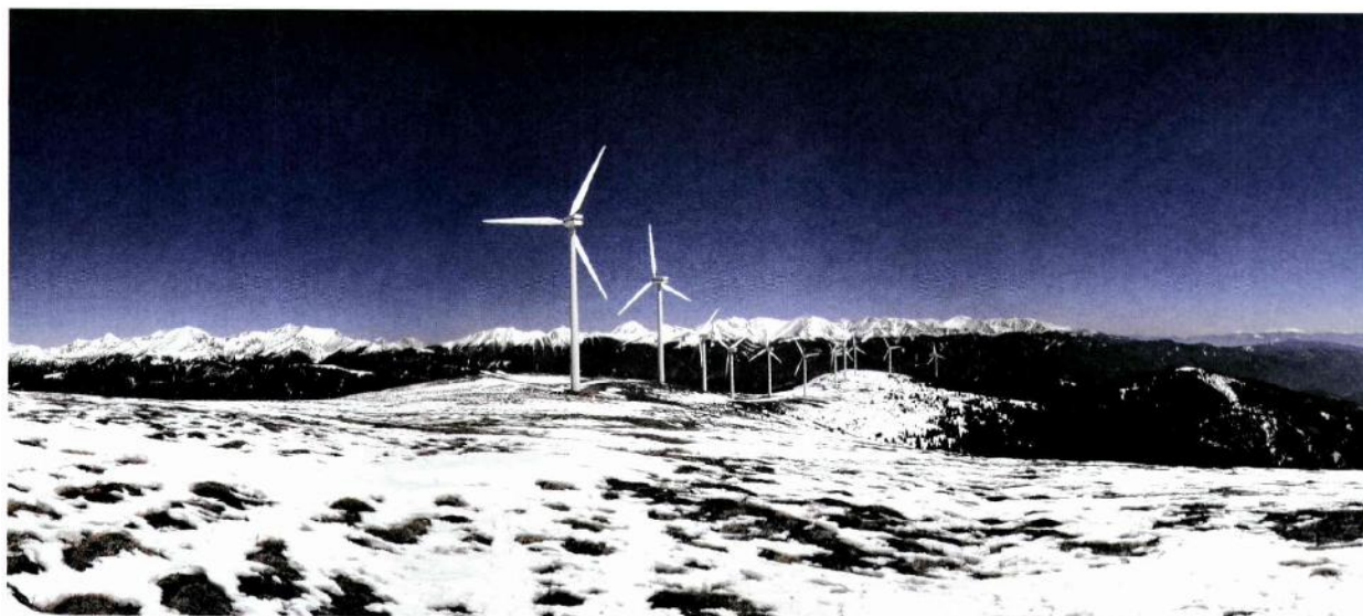
Tauernwindpark Oberzeiring (Österreich) im März (Bild IG Windkraft).

Bei Windkraftanlagen fand eine beachtliche Steigerung statt. Von 1980 bis 2003 hat sich der Jahresenergieertrag verundertfacht. Mit 5-MW-Anlagen wird er sich noch einmal mit fünf multiplizieren (Bild EEG).