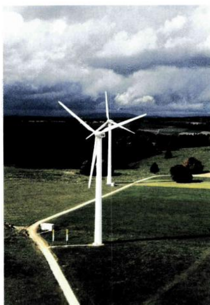
Windturbinen am Mont-Crosin (BE,)