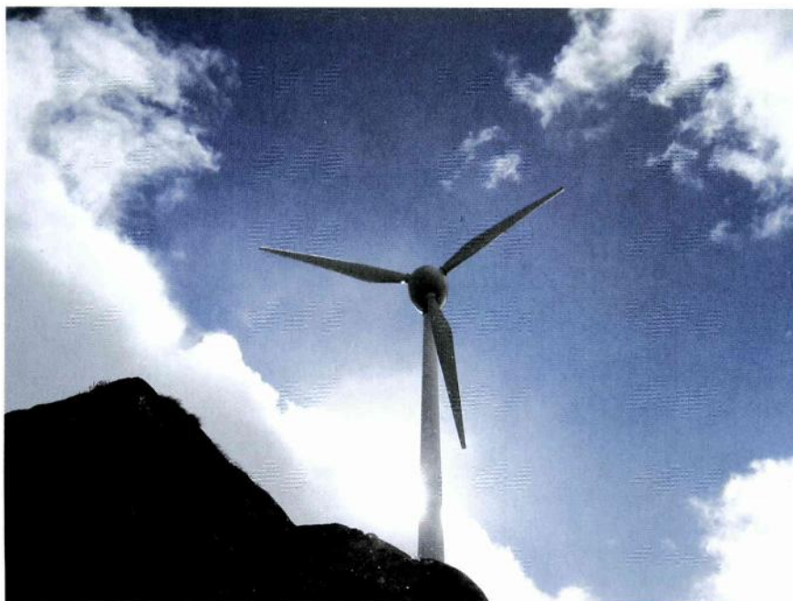
Die neue Anlage auf dem Gütsch ob Andermatt (UR).