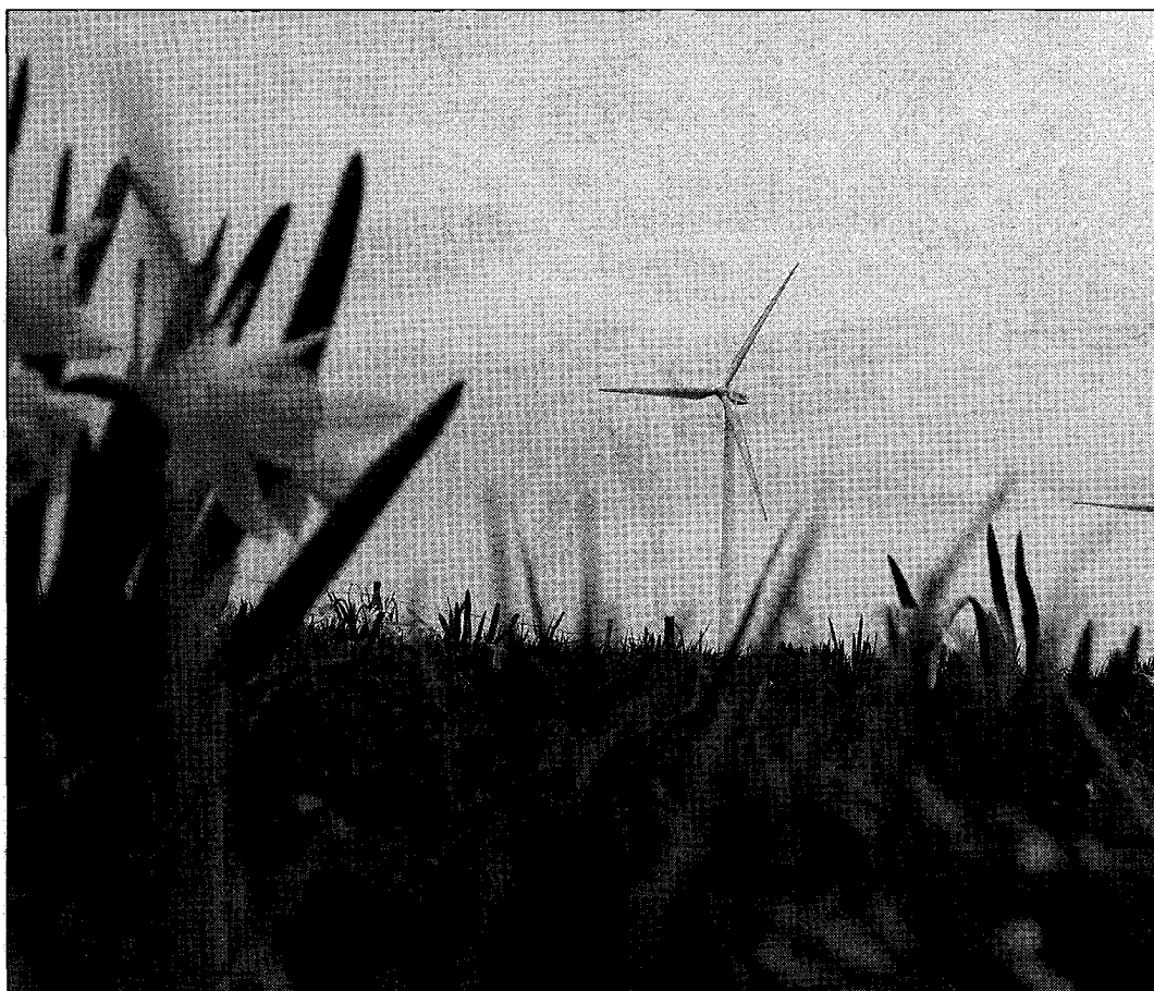
Comme les jonquilles au printemps, les éoliennes de Juvent SA font désormais partie du paysage.