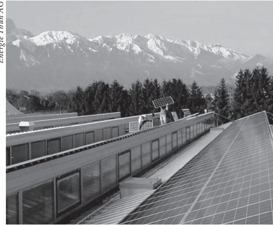
Bei der Fotovoltaik sind in den kommenden Jahren erhebliche Fortschritte bei der technischen Entwicklung und der Produktionseffizienz zu erwarten.

der Fotovoltaikanlage und damit deren Standort und Ausrichtung eine wichtige Rolle.