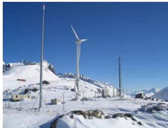
Messstation auf dem Gütsch