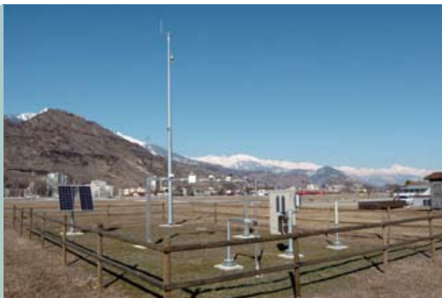
Messstation von MeteoSchweiz in Sion