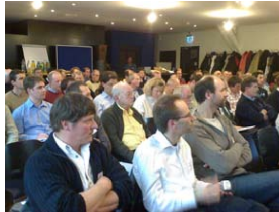
Gut besucht: «Windstrom vom Bauernhof»