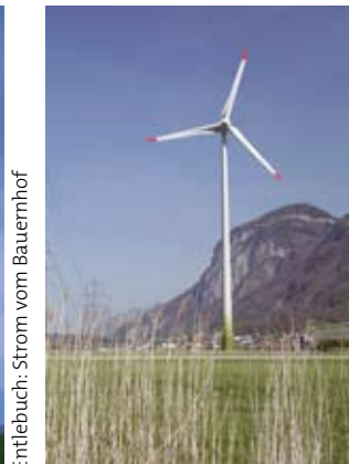
Entlebuch: Strom vom Bauernhof