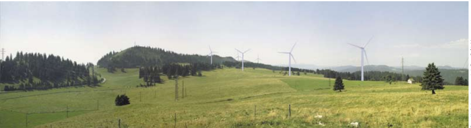
Bereits intensiv genutzt: Der Crêt-Meuron

zogen die Opponenten den Entscheid ans Verwaltungsgericht weiter, das der Argumentation der Gegner folgte und ihnen Recht gab. Dieses Urteil wiederum wurde von der Neuenburger Kantonsregierung und der Betreibergesellschaft Eole-Res ans Bundesgericht weitergezogen.