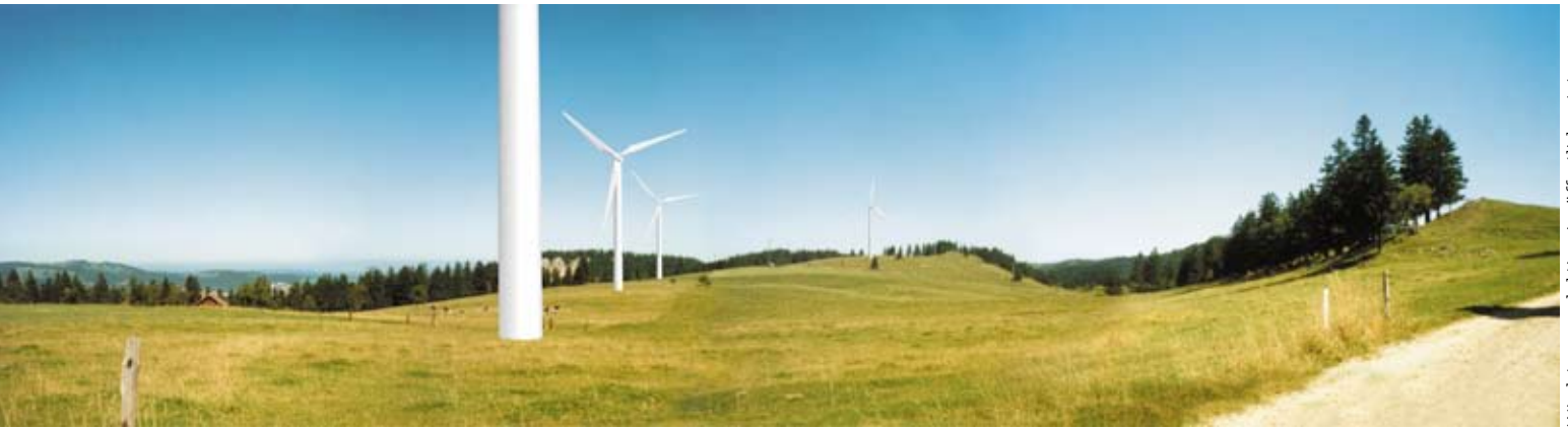
Windstromproduktion: im öffentlichen Interesse

stadtnahen (La Chaux-de-Fonds, Anm. d. Red.), von Spaziergängern und Skifahrern bereits intensiv genutzten Standort, einen verstärkten Schutz zukommen zu lassen, ist geringer als an anderen, weniger gut zugänglichen Orten, deren natürlicher Charakter besser erhalten ist.» Die Richter erinnern daran, dass andere Bauwerke wie beispielsweise Staumauern «ebenfalls an Orten realisiert werden müssen, die schützenswert sind – und wo das öffentliche Interesse an der Ortserhaltung sich nicht durchsetzt, soweit kein absoluter Schutz vorgeschrieben ist».