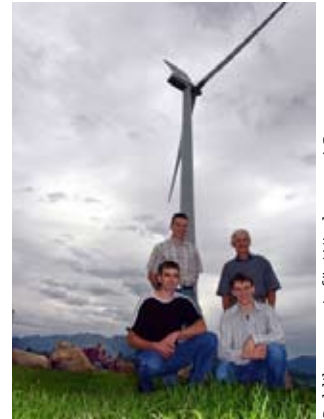
Publikumspreis für Windpower AG