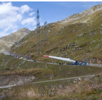
Des moyens de transport perfectionnés