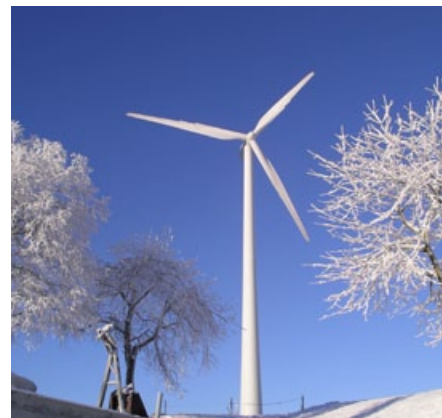
Entlebuch: une deuxième éolienne érigée