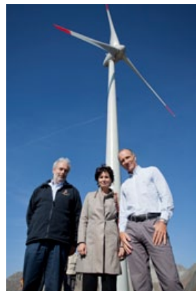
Griespass: rencontre au sommet