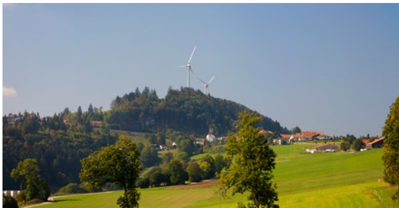
Les Jurassiens sont à 81 % pour l'éolien