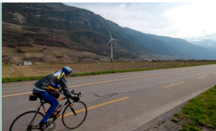
Bientôt une éolienne à Charrat? (photomontage)