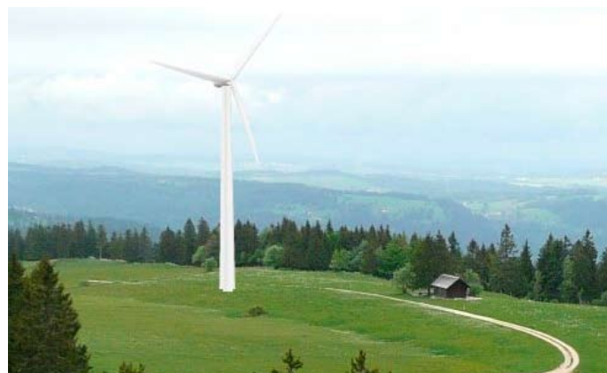
Les photomontages font partie des prestations