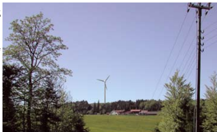
Une des futures éoliennes de Saint-Brais JU (photomontage)