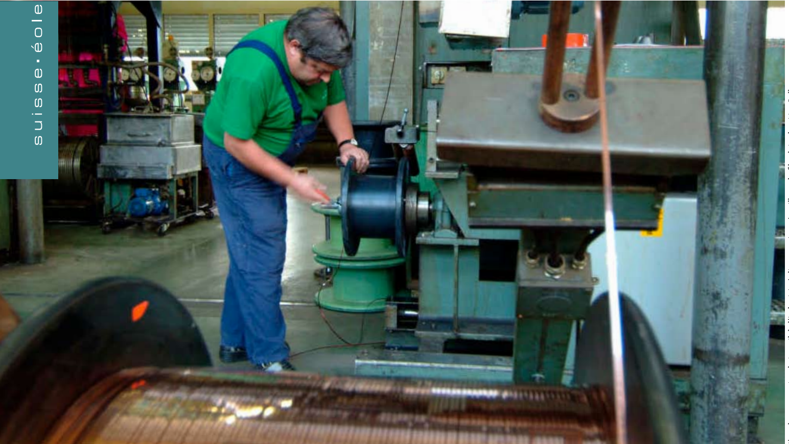
L'un des 350 postes de travail de l'industrie éolienne suisse: émaillage de fils plats chez Von Roll