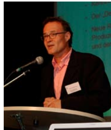
Forum Suisse Eole, 20.4.07