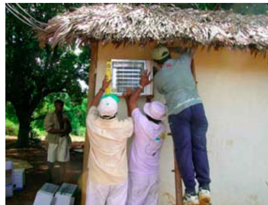
Un vent nouveau à Madagascar